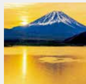
1-2月 本栖湖より富士山／山梨