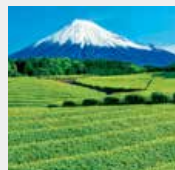
5-6月 大淵窪場より富士山／静岡