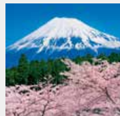
3-4月 富士市より富士山／静岡