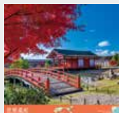
9-10月 / 古都奈良の文化財(日本)