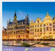
11-12月 / ブリュッセルのグラン・プラス(ベルギー)