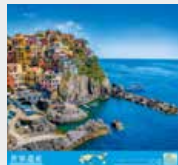
7-8月 / ボルトヴェネーレ、チンクエッテ及び小島群(イタリア)