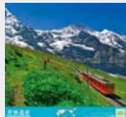
3-4月 / スイス・アルプス エングフラウ-アレッチェ(スイス)