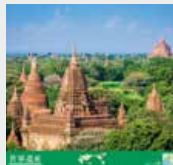
5-6月 / バガン(ミャンマー)