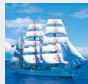
9-10月 / サグレス