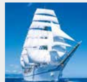
11-12月 / 日本丸