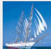
1-2月 / フレデリック・シヨバン