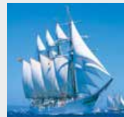
3-4月 / ファン・セバスチャン・ド・エルカノ