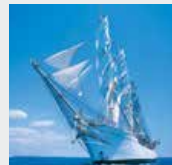
5-6月 / ダンマルク