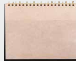
最終ページには、メモや領収書を収納できるPPポケット付き