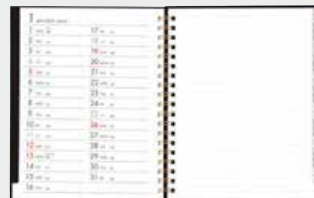
各月の裏面はスケジュール表を掲載し、手帳として使用が可能