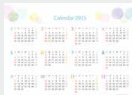
※12月裏面には年表を掲載