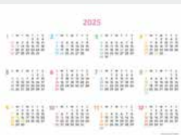
※12月裏面には年表を掲載