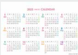
※12月裏面には年表を掲載