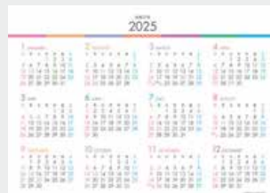
※12月裏面には年表を掲載