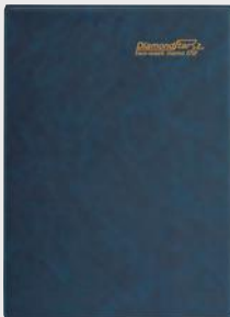
表紙・濃紺(ハード・ビニール)