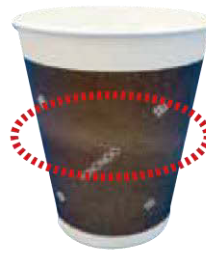
デザインにより、中間部の色合いに色ムラが出る場合がございます。また、印刷機の特性上、上下部分が色濃くなります。