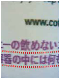
印刷領域に近い箇所へのカスレが発生します。