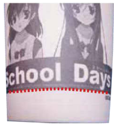
あまり小さい文字サイズの場合、インクのにじみ等により文字が潰れる場合がございます。