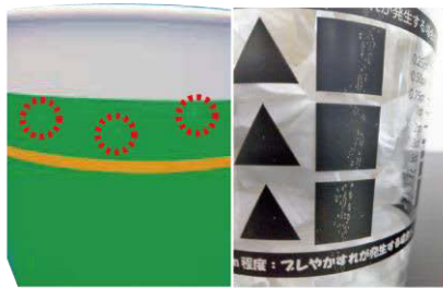
ベタデザインでの印刷の場合、気泡の様な跡が残る場合がございます。